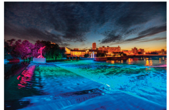
Der Saint Joseph Fluss in South Bend.

Im Jahr 2008 installierte die Stadt South Bend ein Echtzeit-Überwachungssystem mit mehr als 120 Sensoren im gesamten städtischen Kanalnetz. Nach einer gründlichen Datenüberprüfung installierte und nahm die Stadt 2012 zusammen mit EmNet, welches seit 2018 zum Xylem Konzern gehört, sowie mit einem Ingenieurbüro und lokalen Baufirmen, ein Echtzeit-Assistenzsystem in Betrieb. Dieses verarbeitet die Sensordaten, vergleicht die dynamischen Zustände in den einzelnen Kanalsegmenten rund um die Uhr in Echtzeit und steuert die entsprechenden Schieber bzw. Ventile im Kanalnetz vollautomatisch an. Die hierfür genutzte patentierte Steuerungsstrategie führt zum optimierten Bewirtschaften der vorhandenen Stauräume und das Assistenzsystem liefert die entsprechenden Informationen über SCADA-Bildschirme, Smartphones und über ein Web-Portal an die Betreiber. Diese haben ebenfalls jederzeit die Möglichkeit, die Kontrolle über die Steuerung wieder zu übernehmen und die einzelnen Assets manuell zu steuern.