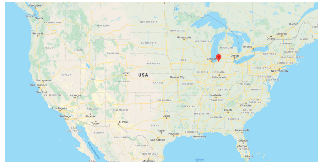
Geografische Lage von South Bend.

Die Stadt hat das Volumen der Mischwasserüberläufe in den Fluss um > 70 Prozent reduziert - was jährlich mehr als 4 Mio m 3 sind - und dadurch ebenfalls die E.coli Konzentration im Fluss mehr als halbiert. Ein Beweis dafür ist, dass sich seit einiger Zeit wieder Lachse und Regenbogenforellen im Saint Joseph Fluss befinden.