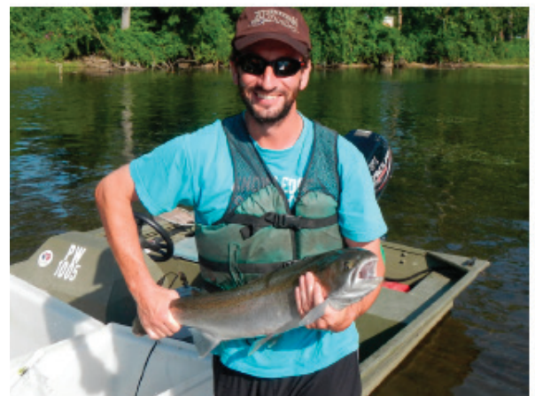
Seit der reduzierten Entlastung in den Saint Joseph Fluss haben sich dort wieder Lachse und Regenbogenforellen beheimatet.