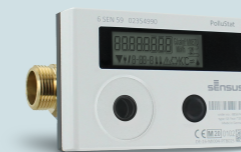
Contadores, sensores y control