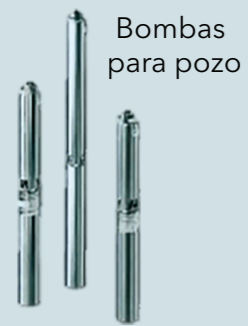
Bombas para pozo